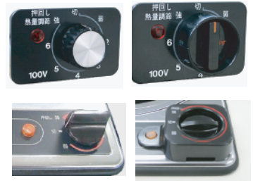
つまみの例。 左が改修前、右が改修後

つまみが飛び出している電気こんろは(右写真参照)、小形キッチンユニット用電気こんろ協議会(0120-355-915)が事業者に連絡して、改修を受けてください。